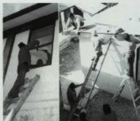
これからの課題—学校施設の「維持管理」 (左) 教室の割れたガラスの取替 (右) 生徒用便所の破風板交換 この様に造るより、維持に今後は細かい気遣いが絶対的に必要になる。