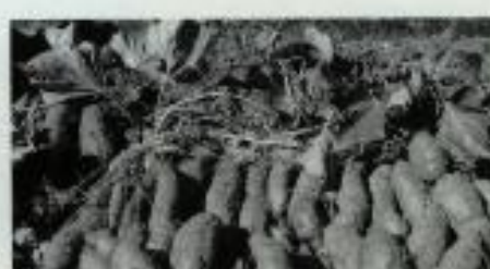
マルチ栽培のサツマイモ 本文参照

このため、ポリマルチ栽培を持ち込むには抵抗もありましたが、日本のように一作で廃棄するのではなく、多少穴はあいても二回ぐらい使うこと。最後には再生利用するための回収業者もあるようなので、処理に方全を期すなど慎重な対応を考えています。