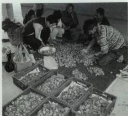
イチゴの選果 取り扱いに課題あり

◆サツマイモ 六月上旬にマルチ栽培の試験をしておきました。今までの試作段階では開花結実したものは糖果せずすべてならして切り、当然のことながら五〇〜六〇gの小玉生産でした。本年は六月上旬に半分ほど摘果したため、玉伸び良好でした。八〇gほどの大玉となり、まだ全量販売になっておらず結論は出ませんが、価格は良いようです。