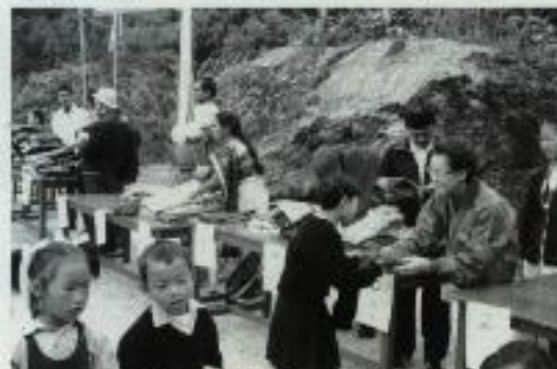
9月、デザイン祭での衣服贈呈式

◆その他 九月デザイン祭の衣服贈呈(バジュバント学校、機関誌発行、ネパールの農場と学校訪問の旅(四頁参照)、古切手、使用済カードの収集、文房具の受付(事務局)