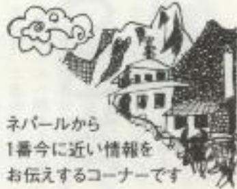
ネパールから 1番今に近い情報を お伝えするコーナーです