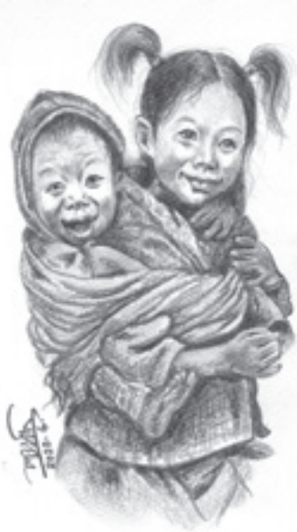
「珍しい農村の女の子」 絵 マン