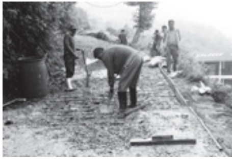
▶学校入口までの区間で行われた舗装工事。右側の奥に見える屋根がブライター学校。

これまで幾度となく石礫を入れたりして補修を繰り返してきましたが、この度、カカニ村の協力で村の予算115万ルピーにより、幹線から学校入口までの72メートルを舗装する工事が行われました。