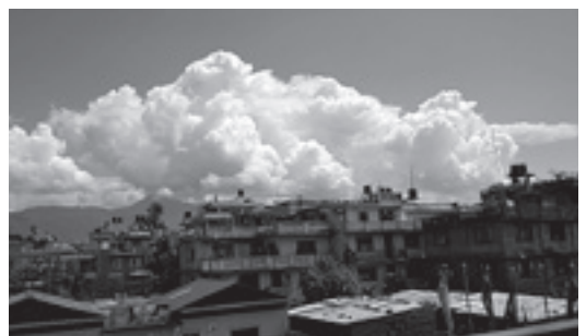
▶何年かぶりにすっきりとした青空が広がった。