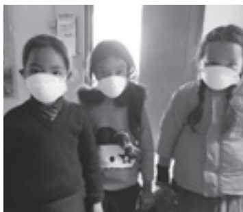
▶マスクのつけ方をならう児童（健康プログラムのコマから）

現在のところ、生徒や家庭、教職員が感染したとの報告はありませんが、医療体制が不十分なことや衛生環境も決して良好とは言えないため、手洗いやマスクの着用など感染防止に一人一人が気を付けて、学校の再開を待っている状況です。