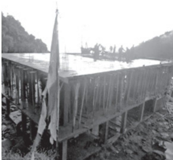
▶雨季に入り雨天が続く中で進められている学生寮の建築工事

学生寮は、これまでも学校内にある滝ハウスや使用しなくなった食堂棟などを利用して、学生たちが共同生活できるスペースを確保してきましたが、今回建築している学生寮は、2階建てで共用