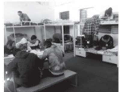
▶既存の学生寮内で熱心に勉強に励むバシファント校の男子の部屋

室2部屋を含めて14室を設け、60人から70人の生徒が利用できるようになります。