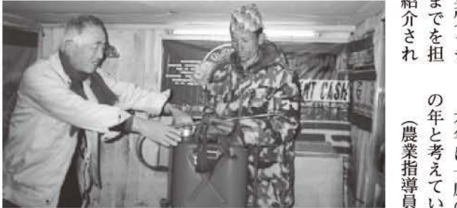
▲ネパールでは農業散布は、一般的ではない。農業と背負式防除機を提供して、防除の重要性を認識してもらう。(ナムター村)

この組合を通じての指導が効果的ですので取り組みを始めました。イチゴ以外のやさい栽培も含め技術伝達のスピードがあがると期待しています。