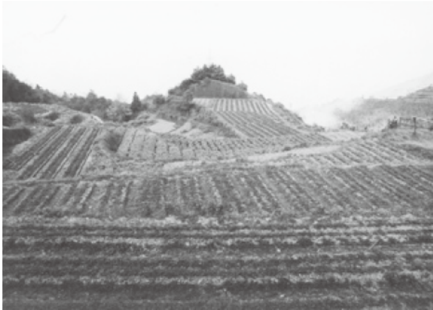
▲カカニ実験研修農場

今後とも、皆様方の一層のご支援、ご参加をお願い申し上げますと共に、是非共、皆様方よりのご提案をお待ちしております。