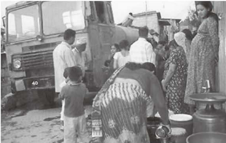
▲給水車で水を求める人々 今年の水不足は深刻。水道の蛇口をひねっても3日に一度しか水が出ない日も。こんな時市の給水車が、大活躍。

今年のネパールは、世界的な異常気象の影響が昨年十月以来、雨がほとんど降らず、四月に入ってから雨が続いたような状態で、水不足が深刻です。