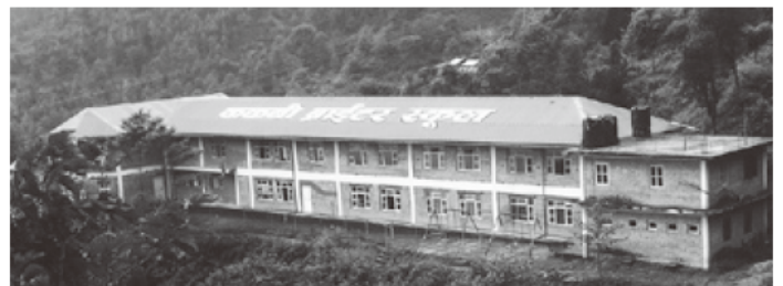
▲カカニ・ブライター学校(カカニ実験研修農場より望む)

This is one of the facilities for JAITI's Foundational Education Project. JAITI is conducting its activities starting from establishment period such as construction of the facilities to its operation as well.