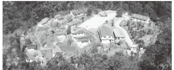
▲レカリ・バシファント学校

This is the hub of the facilities for the Agriculture Extension Project at Kakani area. After conducting various experiments, this project was succeeded to disseminate high valued strawberry crop in this locality.