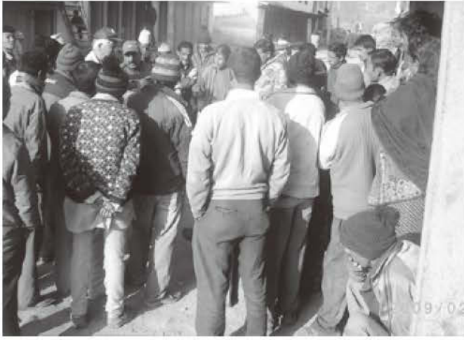
▲ナムター村地区のバルン村にての講習会。水田地帯だが、稲の作付けは全く無し。やさいだと年に2~3作できるし、利益が高いため一生懸命である。

他科やさいでは問題がないことからジャガイモ、ニンジン、スイートコーン、インゲン、エンドウ類などにも取り組み定着の方向となつてきています。本年は一応の取りまとめの年と考えています。(農業指導員 土屋興也)